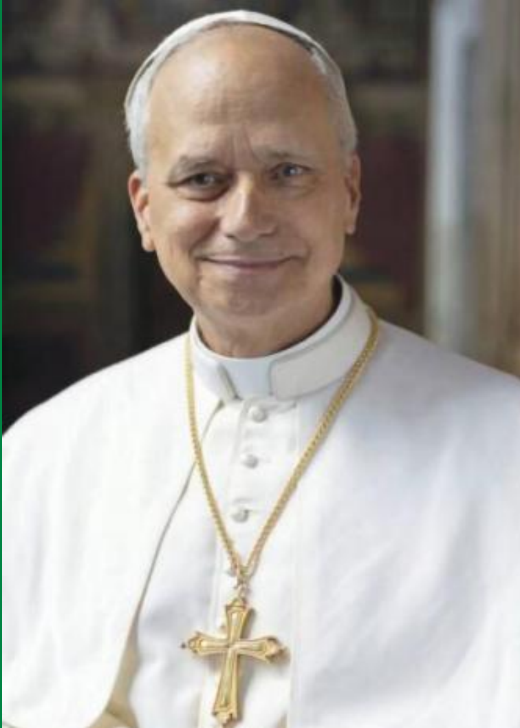
El Papa León XIV nos anima y acompaña.

“El Corazón de Cristo, traspasado por amor, es la carne viva y vivificante que acoge a cada uno de nosotros, transformándonos a imagen del Buen Pastor. En él se comprende la verdadera identidad de nuestro ministerio: ardiendo por la misericordia de Dios, somos testigos gozosos de su amor que sana, acompaña y redime”.