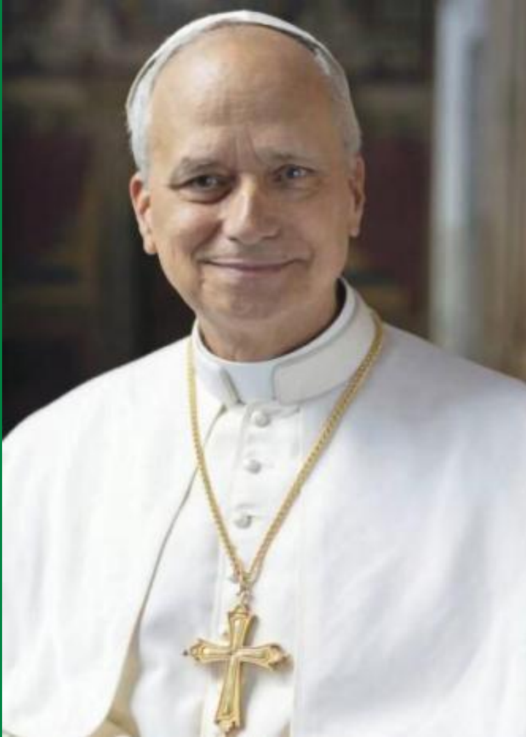
El Papa León XIV nos anima y acompaña.

“Hay también una invitación muy especial para todos nosotros. Lo digo también de manera muy personal: anunciar el Evangelio a todo el mundo. ¡Ánimo! ¡Sin miedo! Muchas veces Jesús dice en el Evangelio: ¡No tengan miedo! Hay que ser valientes en el testimonio que damos, con la palabra y sobre todo con la vida: dando la vida, sirviendo, a veces con grandes sacrificios, para vivir precisamente esta misión”.